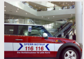
Der 116 116 Info-Cooper beim Achten Kartenforum in Frankfurt am Main