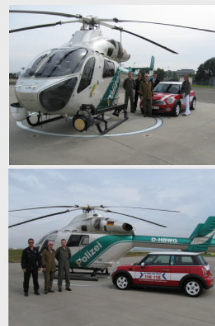
Der Gewinner des Online-Trainers, freut sich über einen Rundflug über Stuttgart

Der Einzelhandelsumsatz ist in den vergangenen elf Jahren von 23,5 (1997) auf 39,6 Prozent im vergangenen Jahr gestiegen. Somit wird ein Drittel des Umsatzes im Einzelhandel über Kartenzahlung abgewickelt. Laut Polizeilicher Kriminalstatistik wurde in 2008 durch gestohlene Karten ein Schaden von über 47 Millionen Euro verursacht. Auch die Sperranfragen unter 116 116 sind um 19 Prozent gegenüber dem Vorjahr gestiegen. 830.000 Anrufer richteten sich 2008 an die bundesweite Notfallnummer.