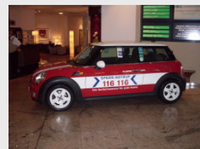
116 116 Info-Cooper auf der Konferenz von kartensicherheit.de im Foyer des Holiday Inn